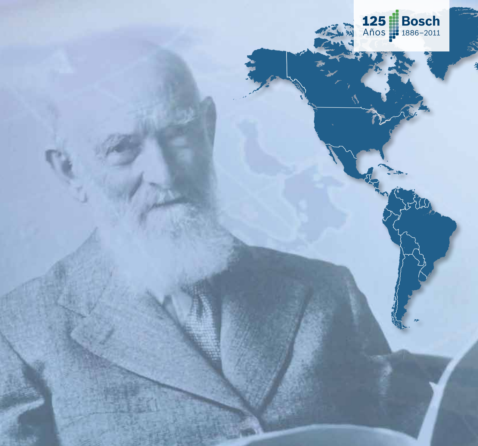
Imagen Institucional Security Systems 2010